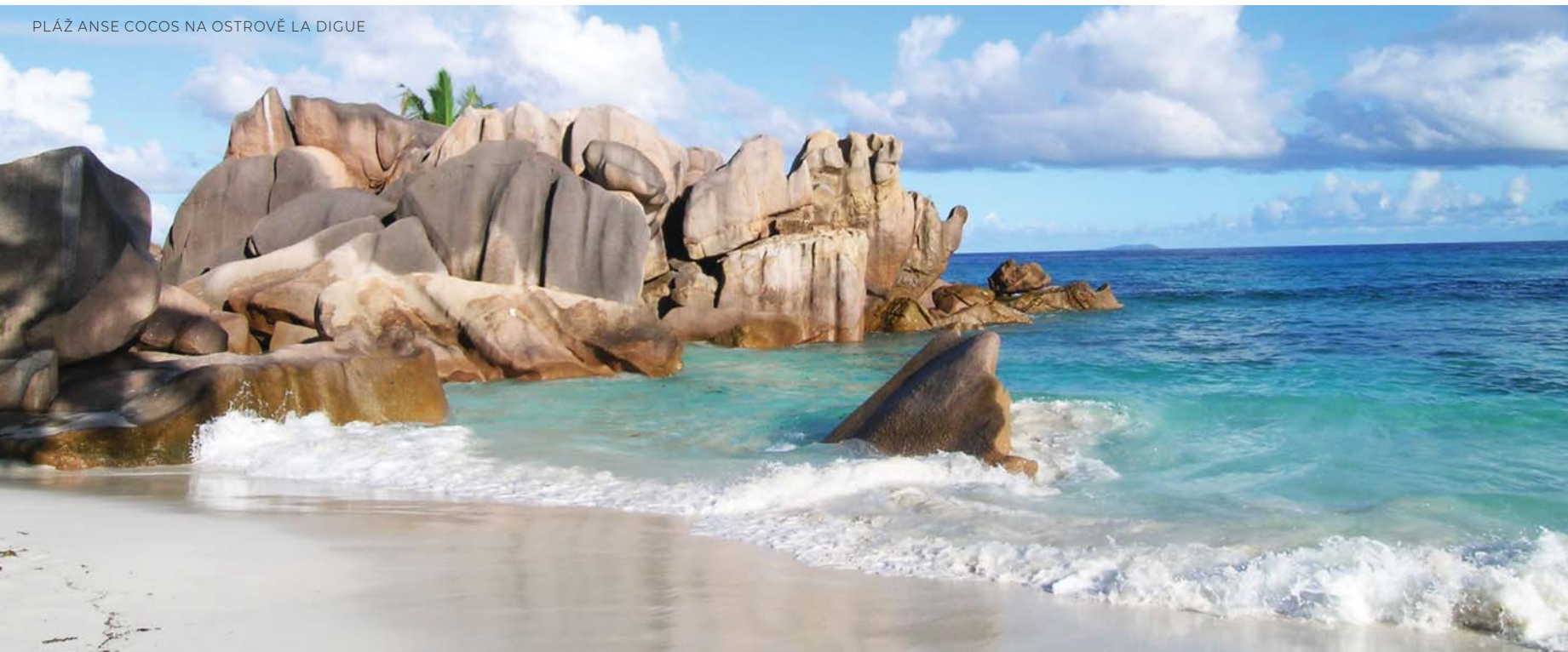
PLÁŽ ANSE COCOS NA OSTROVĚ LA DIGUE

Oproti Mahé rozlohou zhruba čtvrtinový ostrov Praslin není tak hornatý, nejvyšší bod měří pouze 367 m. Hlavní předností ostrova je členité pobřeží s mnoha plážičkami, možnost výletů na okolní ostrovy a především přírodní rezervace Vallée de Mai nacházející se v centrální části Praslinu. Se svou plochou 20 ha je nejmenší lokalitou světového přírodního dědictví UNESCO. Známá je výskytem endemické palmy Coco de Mer (Iodoicea seychelská), která má největší semeno ze všech rostlin na světě. Raritní ořech připomínající ženské pozadí má v průměru 40 až 50 cm a může