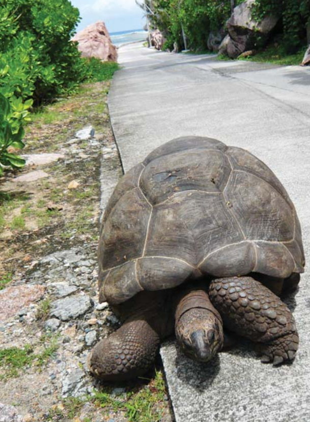
ŽELVA OBROVSKÁ CHVÍLI PO BLOKÁDĚ SILNICE